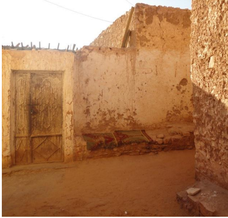
ملحق رقم (3): زاوية ومكتبة الشيخ عثمان العالم الحزيري داخل بلدة الجديد القديمة