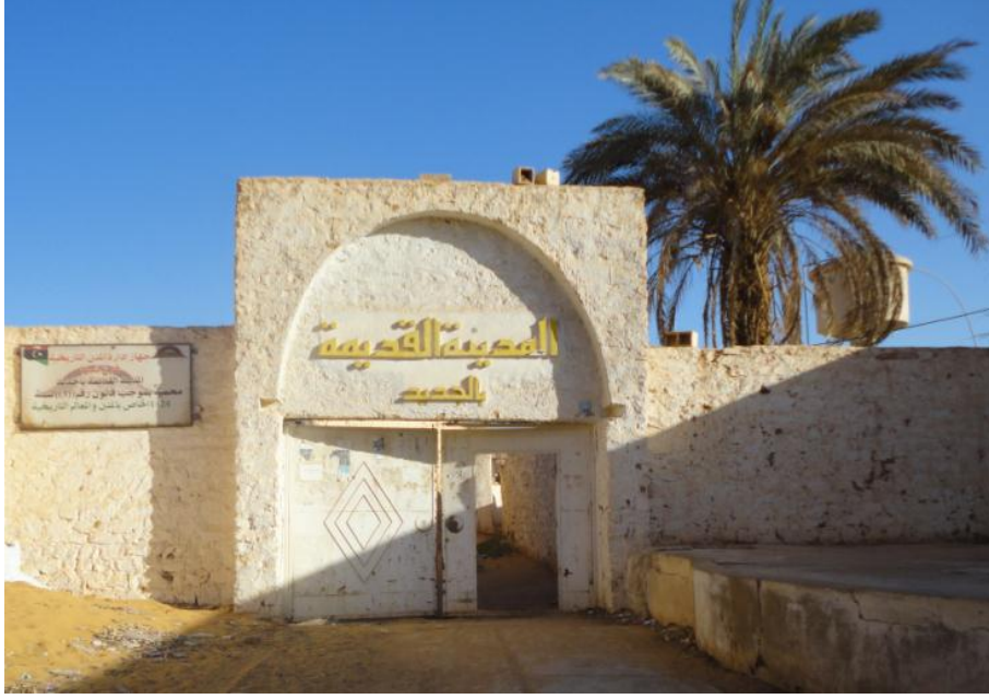
ملحق رقم (5): المدخل الرئيسي لبلدة "الجديد" القديمة (باب جنت عيسى)