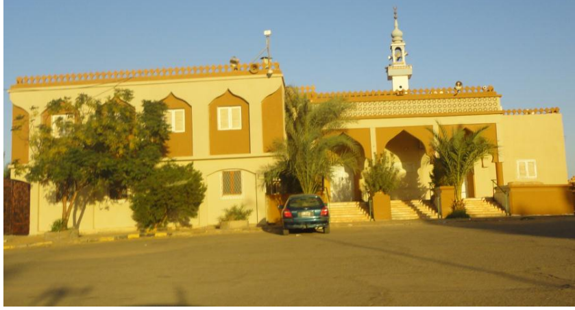
ملحق رقم (1): صورة حديثة للمسجد العتيق ببلدة الجديد القديمة الذي تأسست به زاوية الحضيري