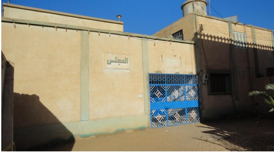
ملحق رقم (2): صورة لزاوية الشيخ حامد الحضيري المعروفة بزاوية المجلس بعد أن تم بناؤها بشكل حديث