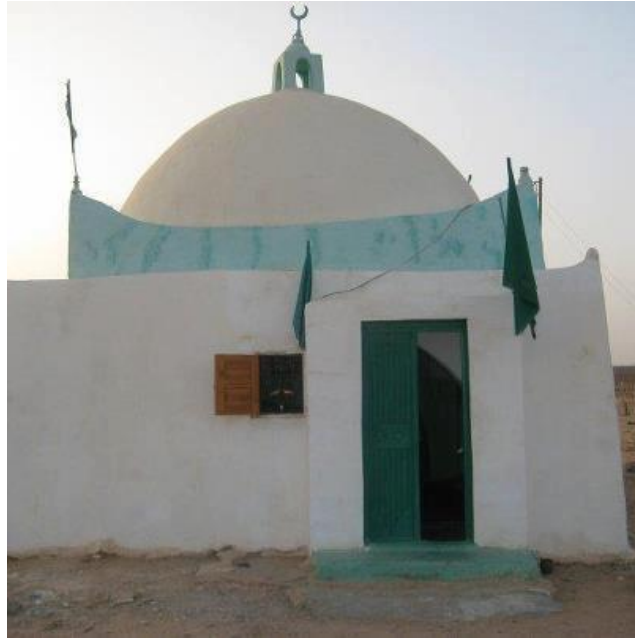
ملحق رقم (6): صورة لضريح الشيخ حامد الحضيري بالمقبرة المشهورة باسمه