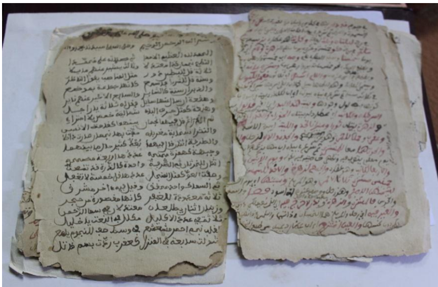
ملحق رقم (8): أوراق في الفلك للشيخ أحمد الدردير الحضيبي